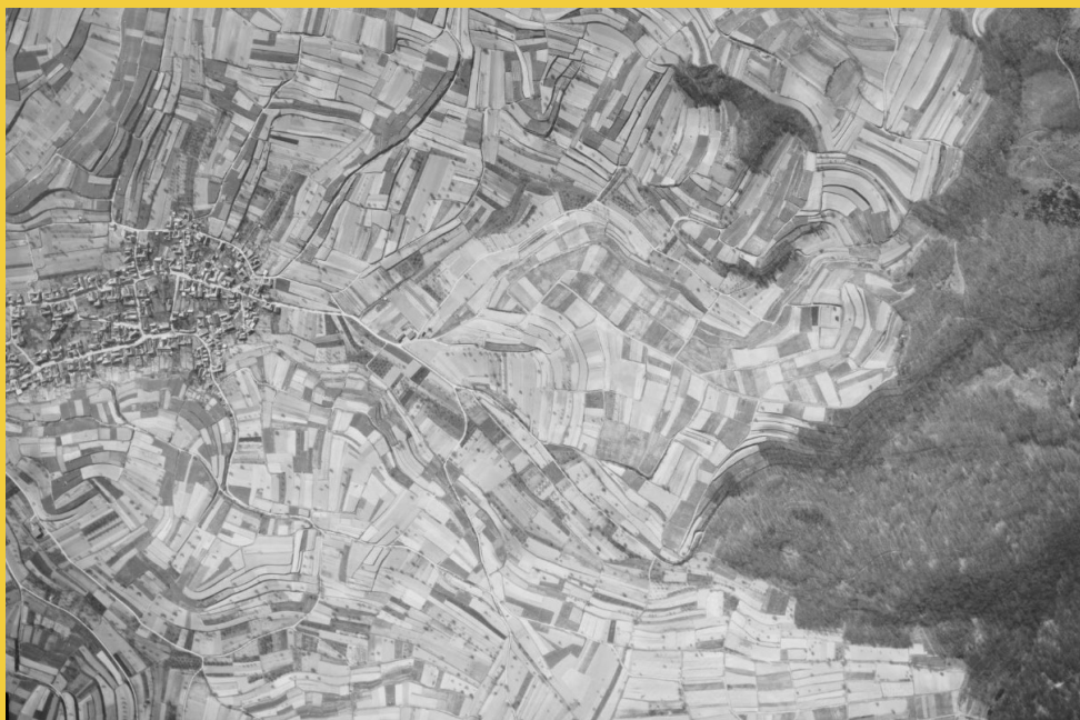
Luftbildaufnahme Eichstetten im Kaiserstuhl 1968